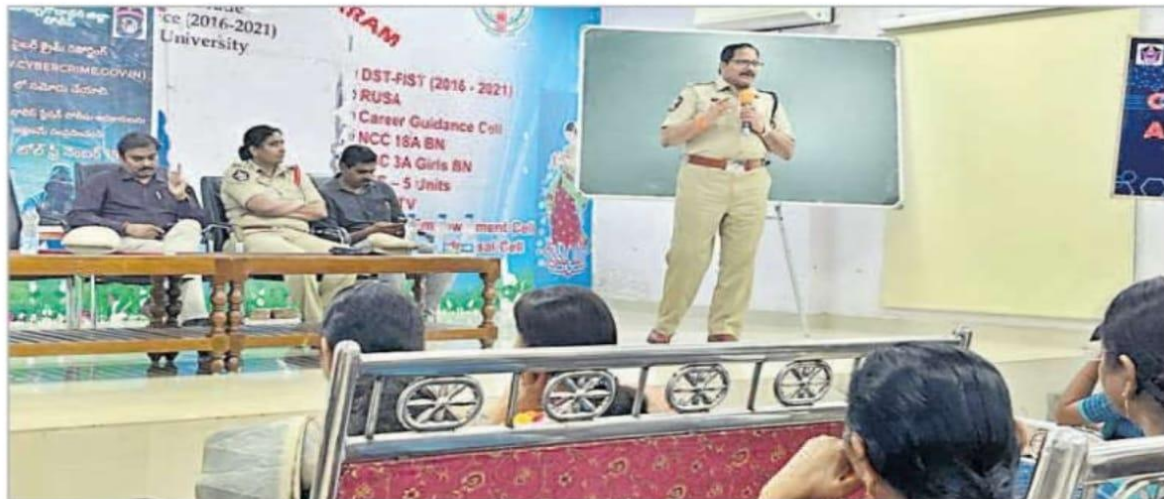
అవగాహన కార్యక్రమంలో మాట్లాడుతున్న అడిషనల్ ఎస్పీ మురళీకృష్ణ