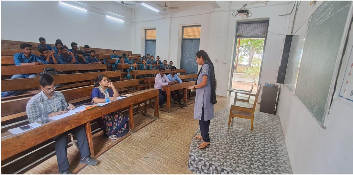
Demo Conducted for the PG Students in II Round