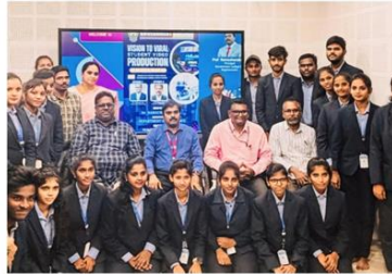
వర్క్ షాపులో విద్యార్థులతో అధ్యాపకులు