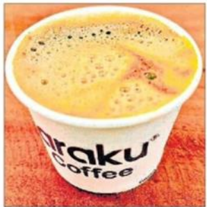
విద్యార్థులు తయారు చేసి లంబిస్తున్న అరకు కాఫీ